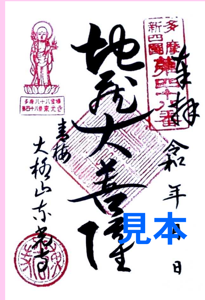
多摩八十八ヶ所第四十八番 地藏大菩薩。東光寺本尊。

※書き置き御朱印の書体です。直接揮毫する場合は、書体が違うことがありますので、ご諒承ください。