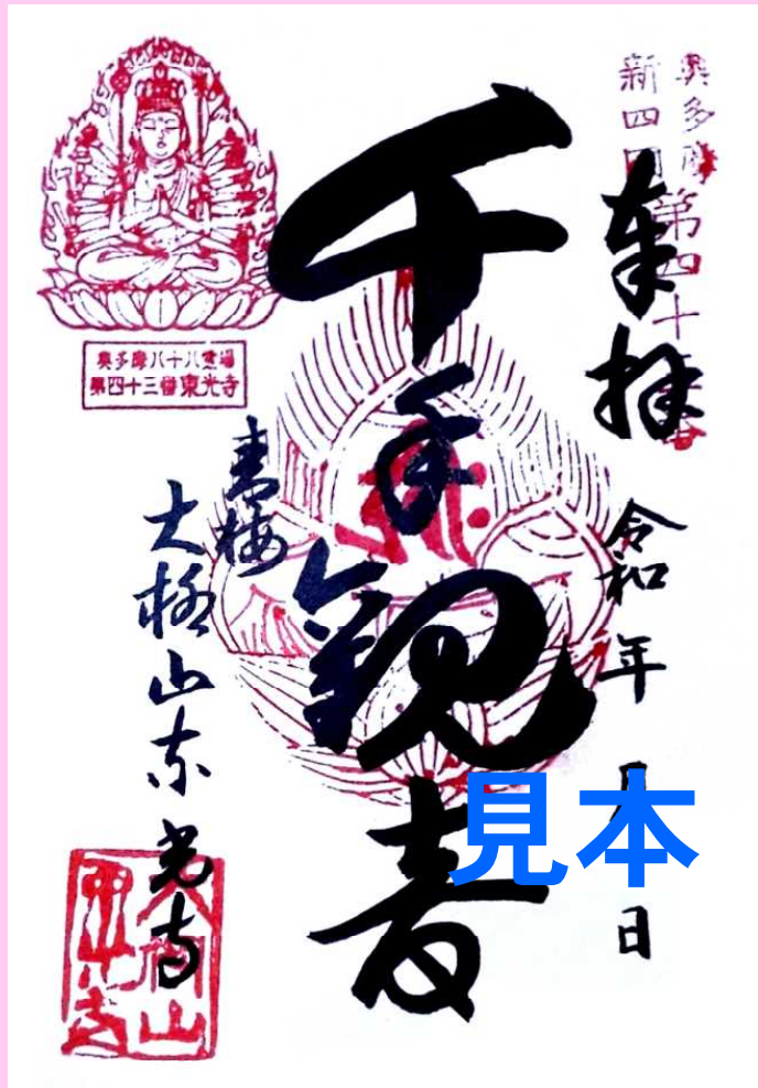
奥多摩八十八ヶ所第四十三番 千手観音。本堂前ご修行像横の石仏。